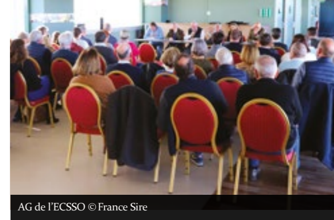
AG de l'ECSSO

La prochaine innovation est prévue le dimanche 21 juillet sur l'hippodrome de La Teste. Le but de cette journée dite « De l'Élevage » est d'inviter nos adhérents à participer à un échange sur l'élevage dans le Sud-Ouest (2 ème volet). Pour l'occasion nous leur demanderont qu'ils soient accompagnés d'amis, de connaissances, afin de leur faire découvrir le monde des courses. De plus nous renouvellerons notre invitation auprès des propriétaires et des entraîneurs, des sociétés de ventes et des représentants des institutions afin qu'ils participent en tant qu'acteurs de la filière à notre journée et qu'ils se fassent connaître auprès du grand public.