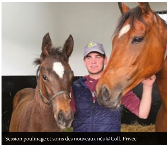
Session poulinaige et soins des nouveaux nés