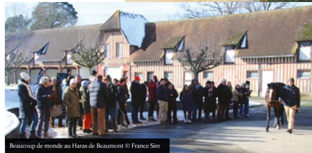
Beaucoup de monde au Haras de Beaumont