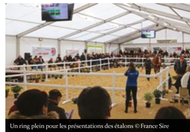
Un ring plein pour les présentations des étalons

65 étalons présentés Plus de 1 800 visiteurs 750 repas chauds servis