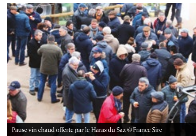
Pause vin chaud offerte par le Haras du Saz