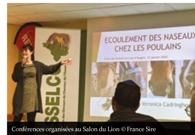
Conférences organisées au Salon du Lion

D'année en année, les échanges entre galopeurs et trotteurs se font plus solides, les étalonniers d'autres régions sont séduits et conquis par cette nouvelle fenêtre d'exposition, différente et complémentaire de la Route des Etalons, et les éleveurs régionaux apprécient que les grandes maisons étalonnnières viennent ainsi jusqu'à eux.