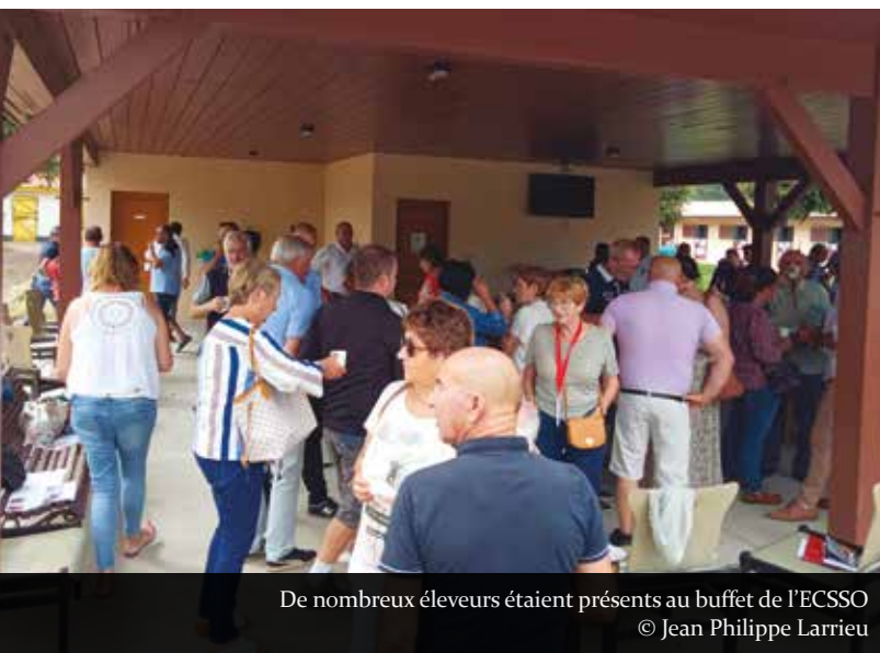
De nombreux éleveurs étaient présents au buffet de l'ECSSO